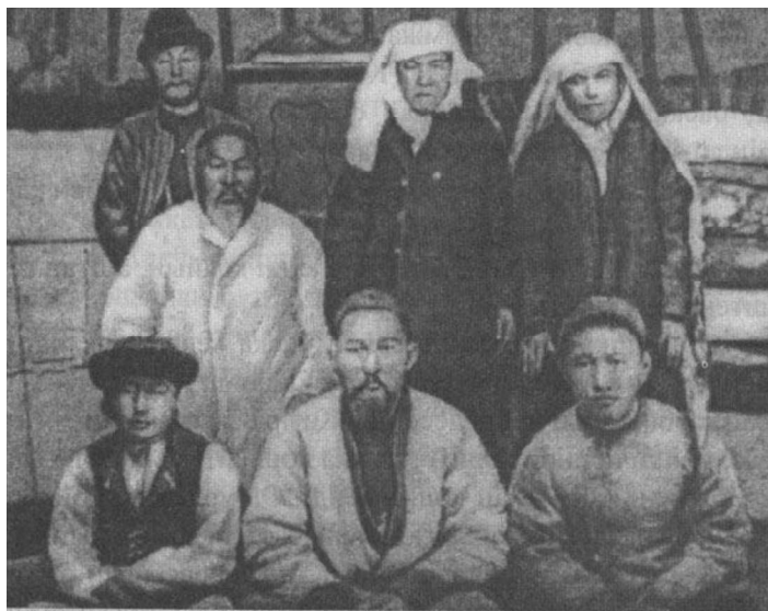
Абайдың 1903 жылғы түскен фотосуреті.

Абай образын ашуда суретшілер портрет, пейзаж және тұрмыстық жанр мүмкіндіктерін молынан қолданған. Бейнелеу өнерінде Абай образын жасауға негіз болған дерек көздері ақынның екі фотосуреті. Біріншісі – 1896 жылы Семейде фотограф Н.Г. Кузнецов түсірген Абайдың ұлдары Ақылбай және Төреғұлмен түскен көлемі 13х9 см фотосуреті [3, 5 б.]. Суретті М. Әуезов 1941 ж. 6 ақпанда Семейдегі Абай мұражайына тапсырған. Екіншісі – 1903 ж. 1 қаңтарда Жидебайдағы үйінің ішінде түскен фотосурет, көлемі 23х13 см. Бұл фотосурет Алматыдағы М. Әуезов мұражайында сақталған.