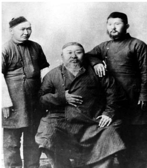
Абайдың 1896 жылы түскен фотосуреті.

Көптеген суретшілер бейнелеу өнеріндегі Абай шығармалары станоктық қондырғылық және монументалдық тұрғыда көрінуімен ерекше көркемдік өлшем үлгісін көрсетеді. Қазақстан суретшілері Абай образын жасауда бейнелеудің графика, кескіндеме, мүсін, қолданбалы өнер, дизайн салаларын қамтыған. Егер бейнелеу өнеріндегі Абай образын зерттеуге оның шығармаларының көркемдік өлшем бірліктерін анықтау проблемасын қосатын болсақ біздің зерттеудің көкейкестілігі онан да арта түседі. Себебі бейнелеу өнеріндегі Абай образын зерттеу үшін оның нақты көркемдік деңгейлерін өлшеу қажет. Қандай мониторинг жасасақ та бізге ең алдымен өлшемдер деңгейін анықтау мақсаты бірінші кезекте тұрады [4, 23 б.].